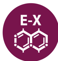
E-X DIÓXIDO DE AZUFRE Y SULFITOS